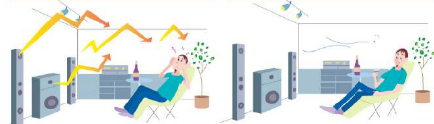
遮音、吸音、音響コントロールを考えた部屋